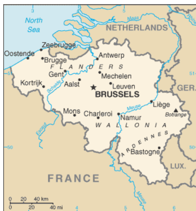
附圖一 比利時地理位置圖

比利時位於西歐的地理中心；北與荷蘭為界，東臨德國、盧森堡兩國，南接法國，西與英國隔海相望（附圖一：比利時地理位置圖）。全國面積約為 32,545 平方公里 (Belgium: 2007a)，與台灣相仿；人口約為 10,392,226 人 (CIA: 2007)， 1 略少於台灣人口的一半。比利時境內地勢平坦屬於平原國家；地勢自西北邊的海岸線逐漸往內陸升高，位於南部的最高點僅約數百公尺，境內沒有高山。