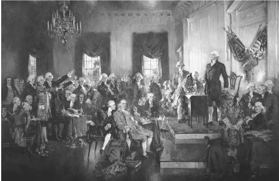
SCENE AT THE SIGNING OF THE CONSTITUTION OF THE UNITED STATES