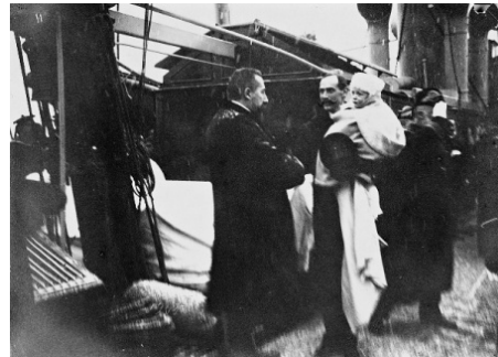
圖 7：四國戰艦護衛哈康七世前往挪威接位（左）